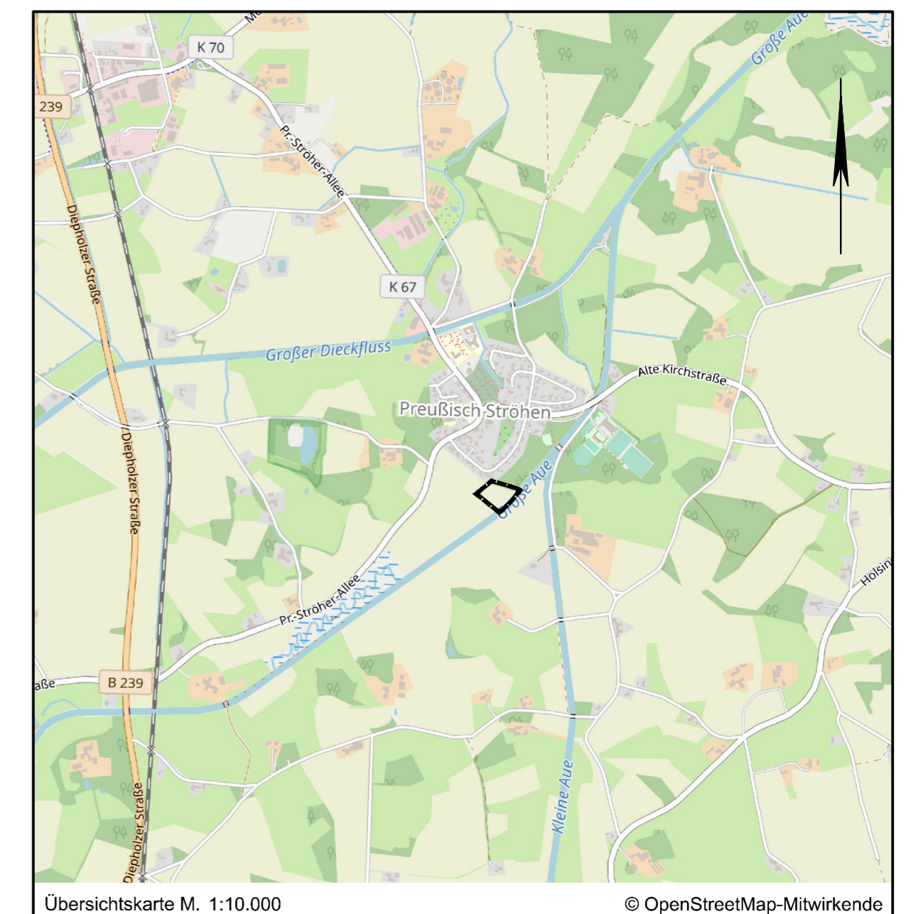
Übersichtskarte M. 1:10.000

Rahden, _____ Bürgermeister/in _____ Schriftführer/in _____